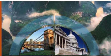
GHG Market Sentiment Survey 2021