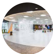
예술교육센터 서서울예술 교육센터 등