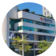
본관 서울문화재단 본관