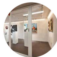
창작공간 서울연극센터, 서교예술실험센터, 금천예술공장 등